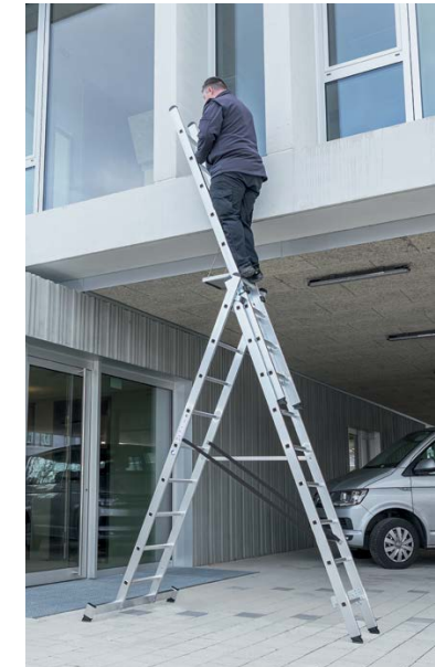
Bestell-Nr. 11108 mit Bestell-Nr. 19910