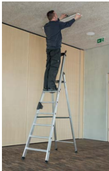
Abb. Bestell-Nr. 40107